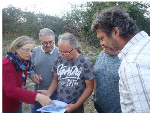
Voisins vigilants dans le quartier du Pied