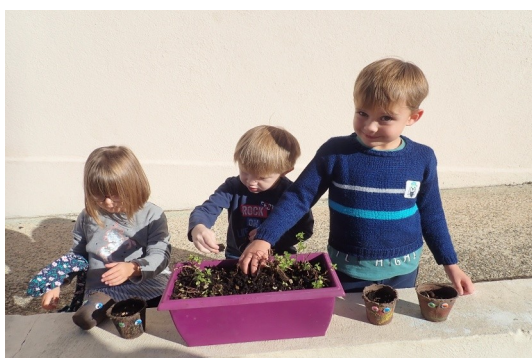
Centre de loisirs d'octobre « Autour de la Terre »