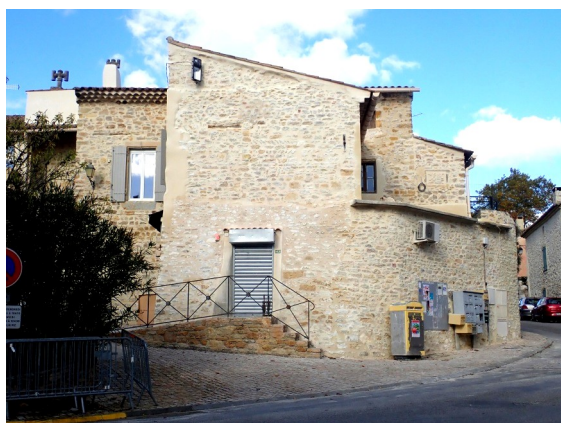
Cure de jouvence pour l'ancien presbytère