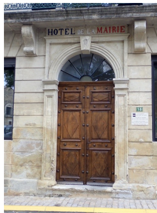
Réfection de la porte d'entrée de la mairie Merci « Lucky »