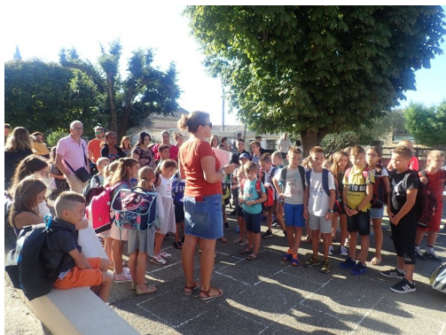
Rentrée des classes le 2 septembre